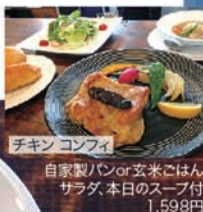
チキンコンフィ 自家製パンor玄米ごはん サラダ、本日のスープ付 1,598円

*大網白里市・東金市の楽しみ方、教えます*がテーマの月イチ発行ライフスタイルマガジン